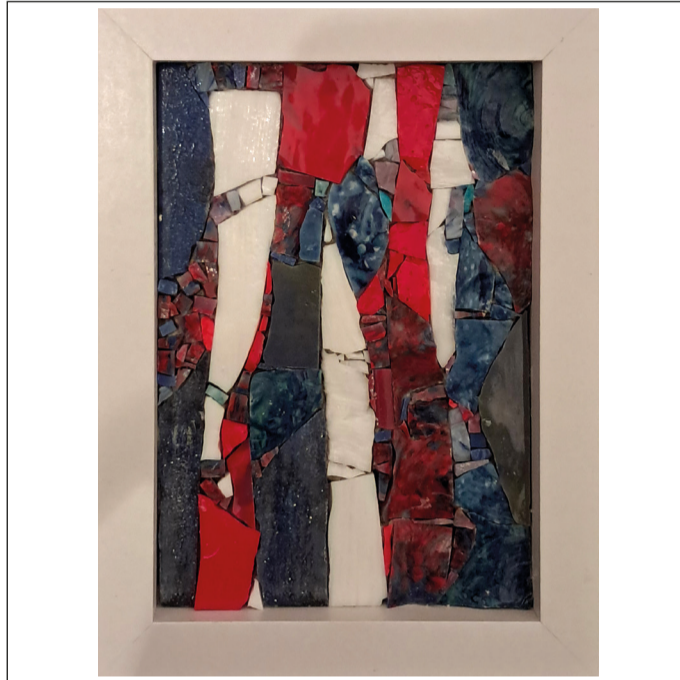
03 - WAVES #3 - 15,3 x 20,4 cm - 2024