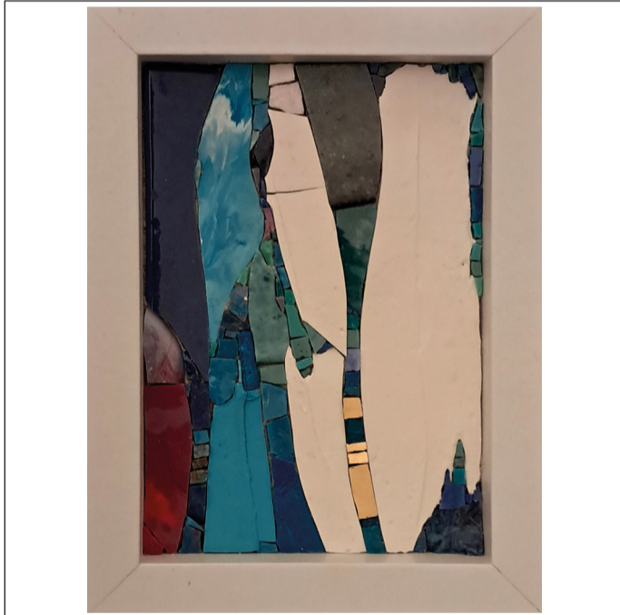
05 - WAVES #5 - 15,3 x 20,4 cm - 2024