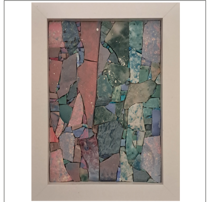
04 - WAVES #4 - 15,3 x 20,4 cm - 2024