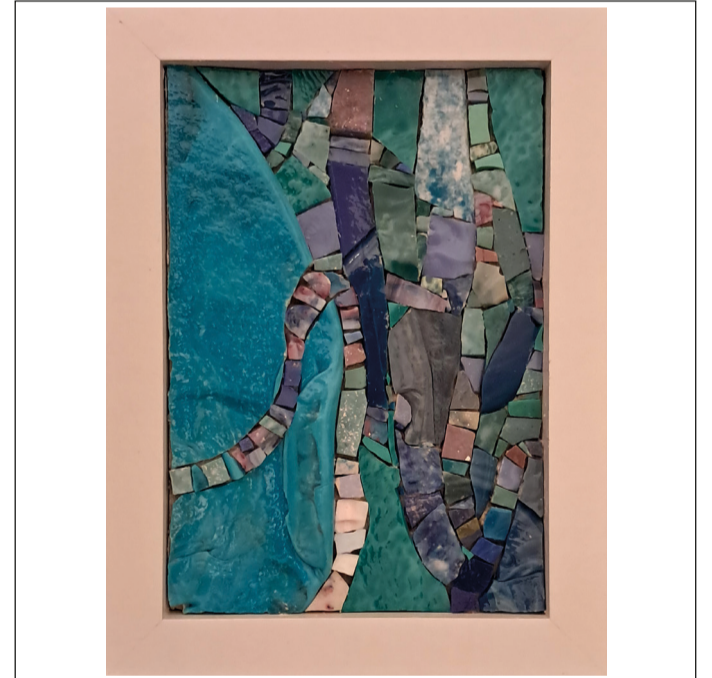
07 - WAVES #7 - 15,3 x 20,4 cm - 2024