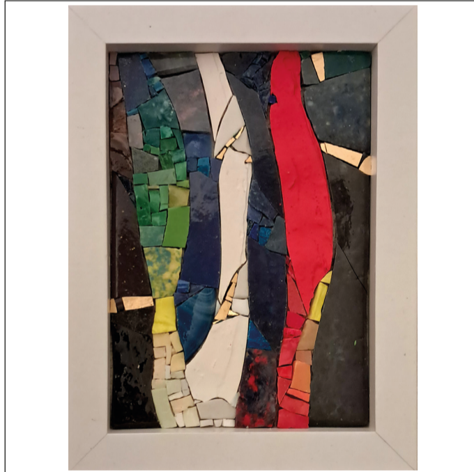
06 - WAVES #6 - 15,3 x 20,4 cm - 2024