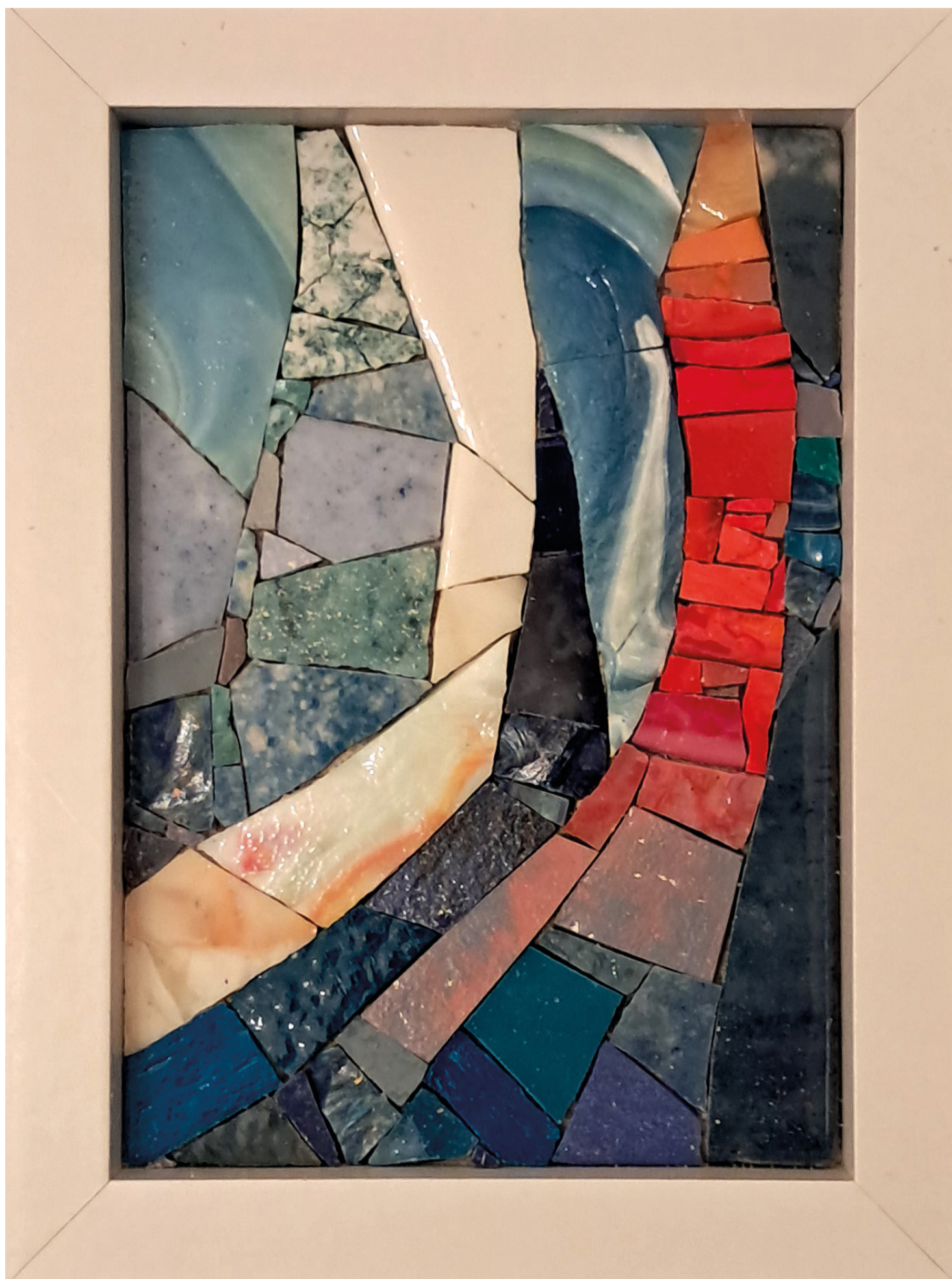
01 - WAVES #1 - Mosaico contemporaneo realizzato con smalti veneziani ed eco smalti - 15,3 x 20,4 cm - 2024

dal 20/09 al 16/10 tutti i mercoledì e i venerdì dalle 15.30 alle 19.30 Creative Lab Mantova - viale Valle d'Aosta 20 Lunetta Mantova www.creativelabmantova.it - info@creativelabmantova.it