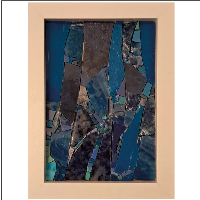
02 - WAVES #2 - 15,3 x 20,4 cm - 2024

Tutte le opere sono realizzate con la tecnica del mosaico contemporaneo realizzato con smalti veneziani ed eco smalti.