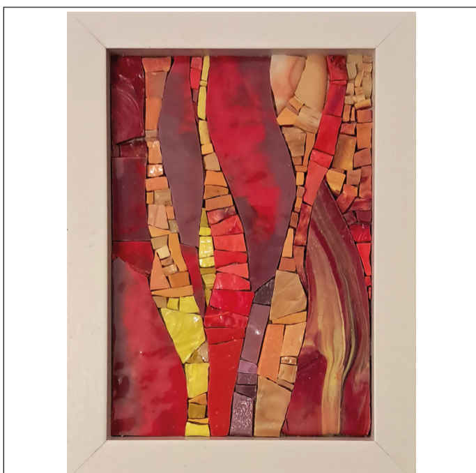
08 - WAVES #8 - 15,3 x 20,4 cm - 2024